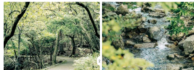
1.えびの高原に流れる小川は高原の動物や植物たちを育てている 2.野鳥や植物、アカマツ林が広がる遊歩道は歩きやすく初心者向け