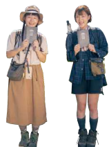
山頂縁のスタンプ集まって帰って来た