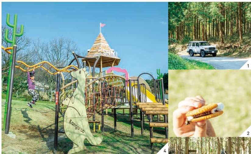
1.9合目登山口は、四季の里旭志キャンプ場から車で約20分の場所にある 2.焼いたマシュマロとチョコレートをクラッカーで挟んだおやつ「スモア」 3.自分の足で登頂して味わえる達成感！水分と食料は多めに持参しよう 4.四季の里旭志の敷地内には大型遊具があり、自由に遊ぶことができる

information ネットヨク熊本 住所/熊本市東区新南部6-3-125 TEL/0120-448699